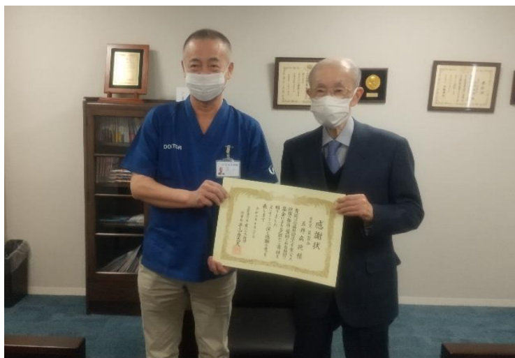
医療法人芙蓉会五井病院 様