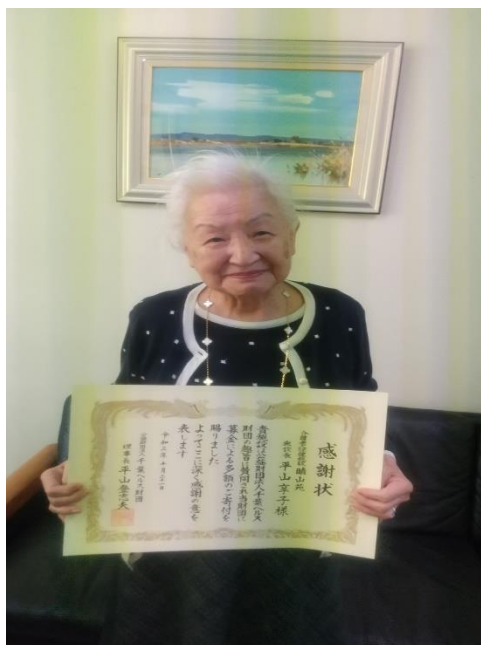
介護老人保健施設晴山苑 様