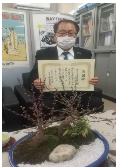
株式会社千葉日報社 様