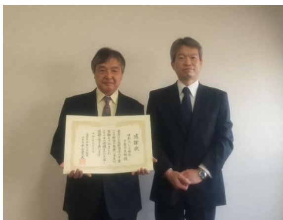
日本 ALS 協会千葉県支部 様