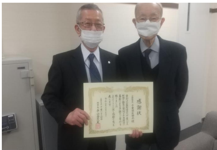
公益社団法人千葉県医師会 様