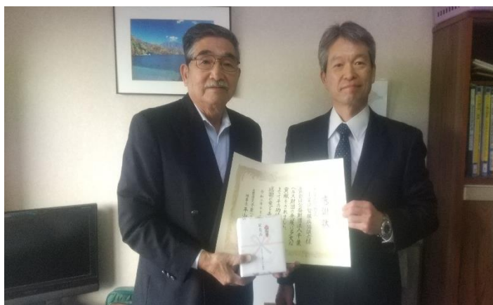
特定非営利活動法人千葉県腎臓病協議会 様