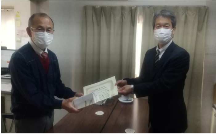
一般社団法人千葉県製薬協会 様