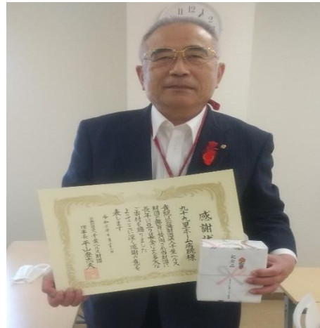
九十九里ホーム病院 様